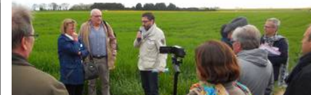
Habitat inter-générationnel: Rots - intervention du CAUE