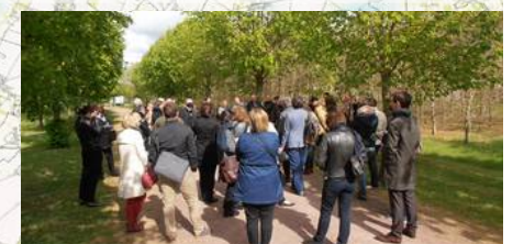
Agricultures et paysages: Soliers - Présentation du Bois communal de l'an 2000, et de la cueillette de Cagny, intervention du comité des fêtes, et de chasseurs