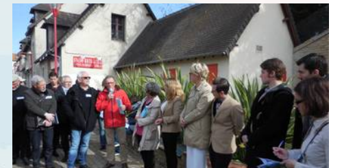
Espaces publics et publics spécifiques (jeunes, seniors...): Douvres la Délivrande - interventions de centurly 21 et de la ligue de basket