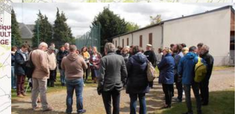
Mobilités: Bretteville-sur-Laize - intervention de l'Auto école et de l'association « travail - emploi - formation »